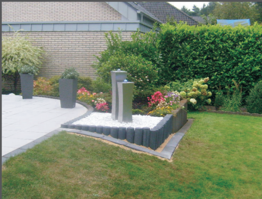
Brunnen mit LED-beleuchtung