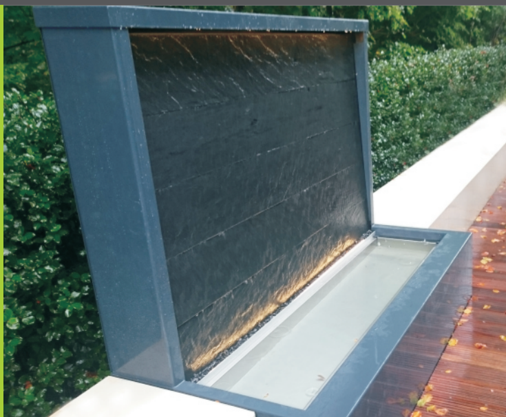
Granit Wasserwand Edelstahl Pulverbeschichtet